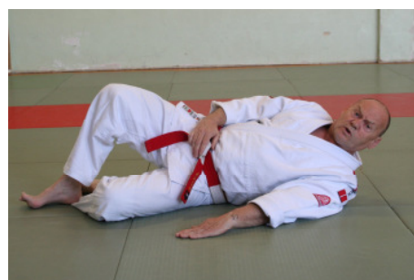
Yoko ukemi (Migi/Hidari)